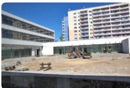
Im Innenhof begegnen sich alt und neu