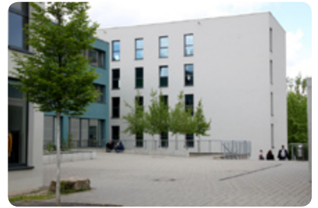
Leere Schulhöfe. Noch sind wenige Kinder in den Schulen

Mit dem Schulhund „Luna“ ist ein Stück Alltag an die Lobdeburgschule zurückgekehrt. Er ist ein wichtiger Begleiter der Schulsozialarbeit und ein Garant, dass es aufwärts geht.