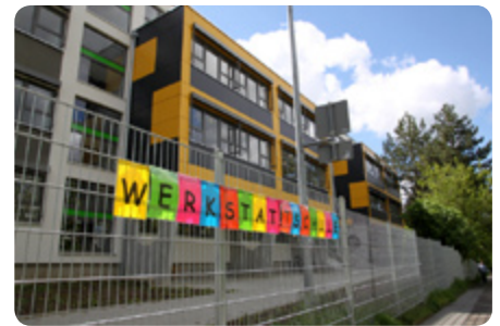
Die Werkstattschule ist in die Emil-Wölk-Straße eingezogen

Umzug mitzuhelfen, was wegen der Distanzregeln natürlich nicht ging“, erzählt die Sozialarbeiterin. Ihren Raum hat sie mit einer Kuschelecke ausgestattet, die Schüler hoffentlich bald nutzen können. „Das Wichtigste ist jetzt, zu den Schülern, die uns brauchen, Kontakt zu halten. Ich arbeite auch über die sozialen Medien wie WhatsApp.“