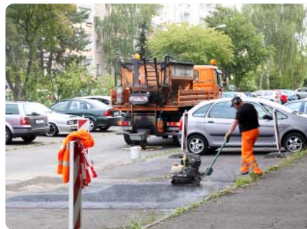
Der stadteigene Bauhof repariert Flächen auf dem Parkplatz in der Richard-Sorge-Straße in Lobeda-Ost

Am Saaleradweg in Lobeda-West werden Gefahrenstellen, die durch aufgewölbte Baumwurzeln entstanden sind, behoben. Die Sanierung des straßenbegleitenden Radweges Stadtrodaer Straße im Bereich der Kastanienstraße ist Ende August vorgesehen. Beide Maßnahmen werden in Eigenleistung des Kommunalservice ausgeführt.