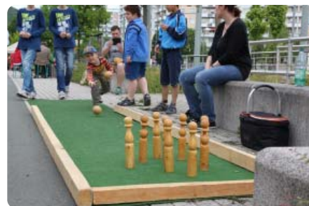
Auch die Jüngsten zeigten viel Geschick und trafen