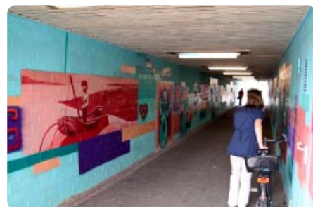
In kräftigen Farben leuchten die ausgestalteten Felder, die auch die Silhouette der Wohnhäuser andeuten

Hinweis: Die Streetworker stellen ab sofort jeden Donnerstag ihr Sofa zwischen Allendeplatz und Tunnel auf.