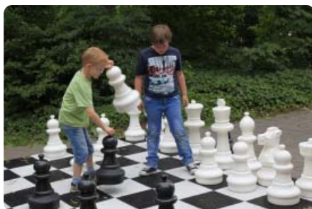
Früh übt sich, wer ein Meister werden will