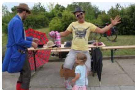
Viel Spaß gab es mit dem Clown des Vereins Freie Bühne