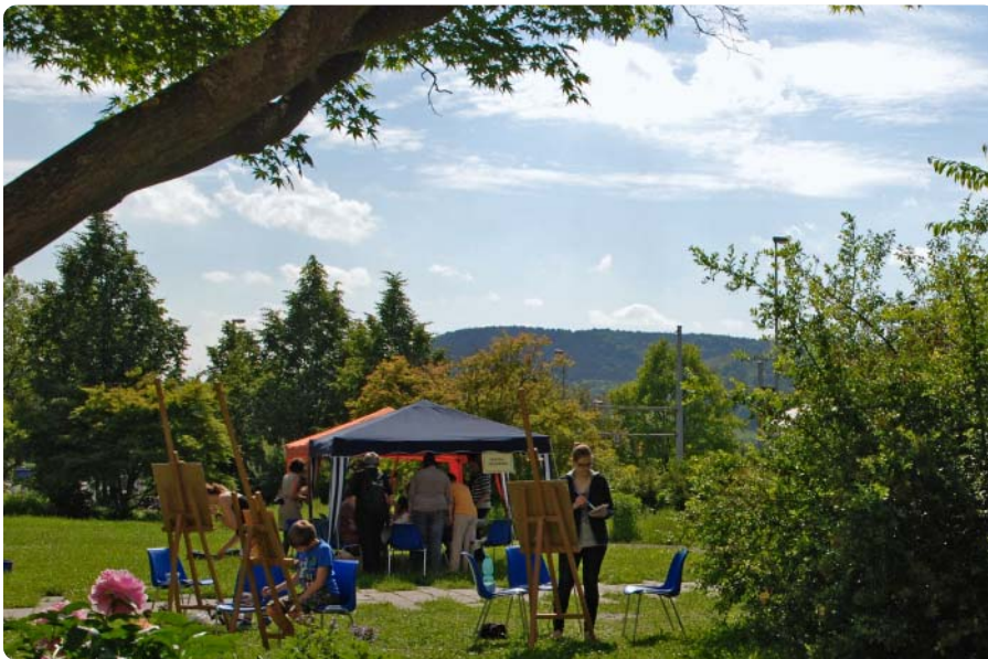
Die Galerie wird sich vom 1. bis 5. Juni wieder in ein offenes Atelier verwandeln.

Kunstprojekt an der Galerie geht in die fünfte Runde