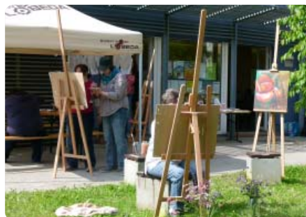
Bei schönem Wetter wird das offene Atelier, so wie (hier) im letzten Jahr, vor der Galerie zum Mitmachen eingeladen.

3. bis 6. Juni , jeweils 15-18 Uhr offenes Atelier. Vernissage: 6. Juni 14 Uhr in der Stadtteilgalerie Lobeda