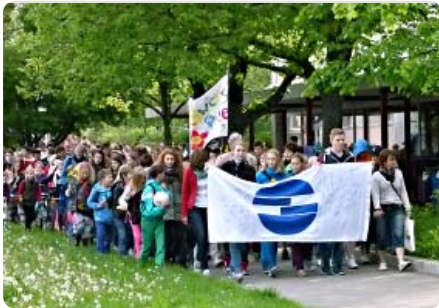
Schüler und Lehrer auf dem Weg zum neuen Schulcampus

Anfang Mai zogen die Schott-Gymnasiasten vom alten Schulstandort in Lobeda-Ost durch den Stadtteil in die Karl-Marx-Allee. Lange hatten sie auf diesen Tag gewartet. Entsprechend groß war die Freude, endlich in das frisch sanierte Gebäude einzuziehen. Neben hellen Schulräumen steht ihnen eine neue Aula, die auch als Kantine dient, und ein Campus zur Verfügung. Das dreizügig angelegte Schottgymnasium teilt sich das Gebäude mit der Gemeinschaftsschule „Kulturforum“, die den zur Saale hin gelegenen Gebäudeteil nutzt. In die Sanierung und den Neubau des Schulstandortes Karl-Marx-Allee 7 wurden 1,5 Millionen Euro investiert.