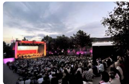
ArenaOuverture 2013, Foto: Holger John

Fr, 20.6. und Sa, 21.6. jeweils 21 Uhr ArenaOuverture „American Summer Dream“ mit der Jenaer Philharmonie