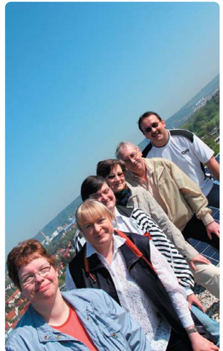
Die Stromsparhelfer kommen in die Wohnung und überprüfen den Stromverbrauch Ihrer Geräte