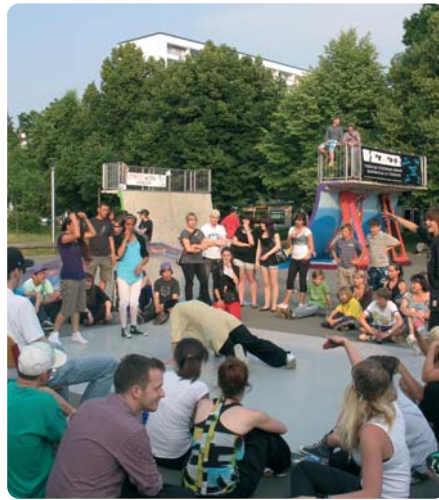
Streetwork Lobeda hat mit den soziokulturellen Stadtteilprojekten vor allem Lobedaer Jugendliche erreicht.