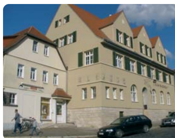
Gasthaus „Zum Bären“