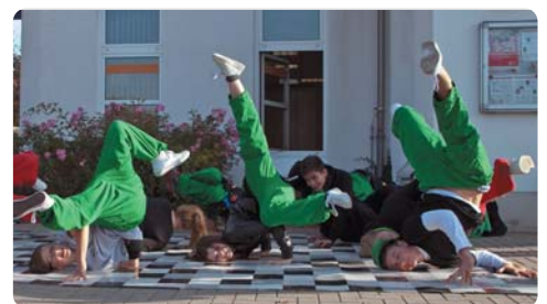
Bewegungsküche e.V. in Aktion