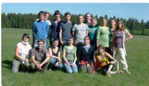
Kindersprachbrücke Jena e.V.