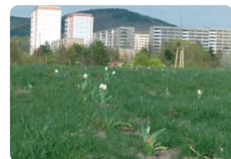
Park auf dem Lobdeburgtunnel Seite 2