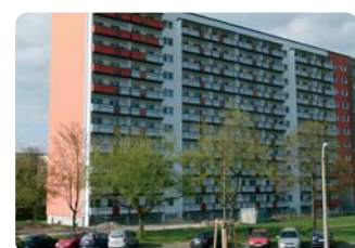
Anspruchsvolle Fassade Seite 2