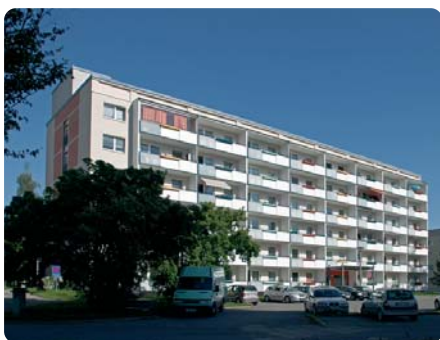
In der Ernst-Schneller-Straße 10 entsteht Lobedas erste Senioren-WG.

Interessenten an der Wohngruppe können sich bei Antje David (jenawohnen) unter 84 42 20 oder bei Monika Schauroth (DRK) unter 40 01 14 melden.