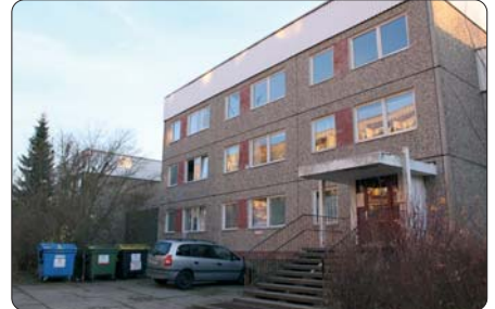
In diesen Tagen ziehen die letzten Bewohner aus der Carolinenstra e aus. Danach soll f r studentisches Wohnen saniert werden.

Investor in Aussicht, der einem anderen gro en Problem in Jena Abhilfe schaffen will – dem studentischen Wohnen. In den n chsten Wochen soll es Gespr che  ber die Vertragsgestaltung geben. Das Projekt soll, wenn es gelingt, im Ortsteilrat vorgestellt werden.