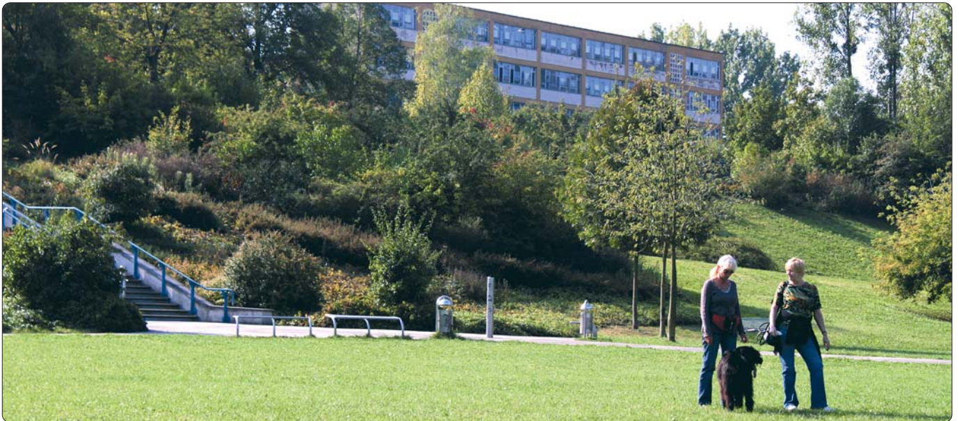
Die Expo-Flächen in der Saaleaue bei Lobeda sind eine Augenweide

Lobeda ist das grüne Herz Jenas. Kein anderer Stadtteil hat so viele Rasenflächen und Plätze wie die Großsiedlung an der Autobahn. Die Begrünung war Teil der Gebietsplanung und fiel in den Anfängen in Lobeda-West noch sehr großzügig, in Lobeda-Ost mit knapper werdenden Mitteln entsprechend sparsamer aus. Doch auch in den letzten Jahren sind viele Anlagen dazu gekommen oder neu gestaltet worden.